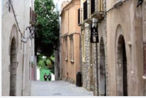
Ibiza'nın Akdeniz adalarına has dar sokakları...