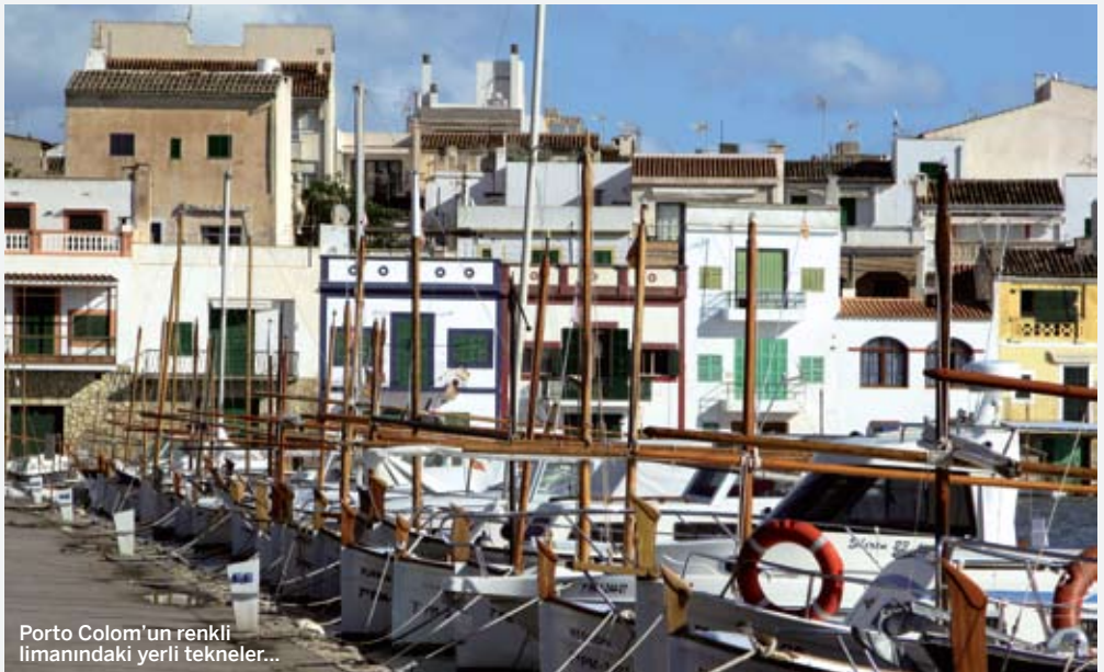
Porto Colom'un renkli limanındaki yerli tekneler...

Ertesi sabah, bu sefer lodostan bastıran yeni bir fırtınanın uğultusuyla uyandık. Anlaşılan Akdeniz'den çıkana kadar havadan yana rahat edemeyeceğiz. Neyse ki bu kez emniyetli bir koydayız, ama koyun ağzı güneye açık. Öğleye doğru, fırtınanın soluğanları içeri girmeye başladı. Akşam bir yere tutunmadan ayakta duramıyorduk. Saatler ilerledikçe sallantı da arttı. Üzerinde yelken olmadığı için iki yanına devrilen teknede, gece yalpayla yuvarlanmamak için yatağa yapışmaya çalışmaktan uyumaya fırsat olmadı. Vardiyalarla geçen yorucu bir gecenin sabahına kalkıyormuş gibi yataktan çıktık. Hâlbuki bir yere gittiğimiz yok, sözde limandayız... ➤