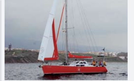
Fırtına sonrası limana giriyoruz.