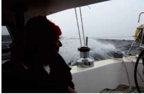
Akdeniz'de kışın etkisi...