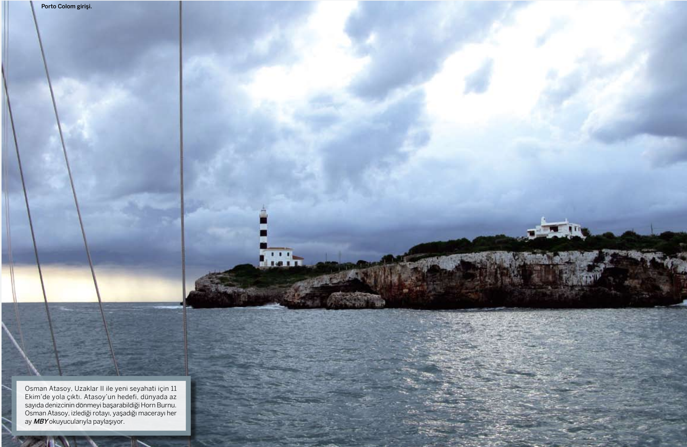
Porto Colom girişi.