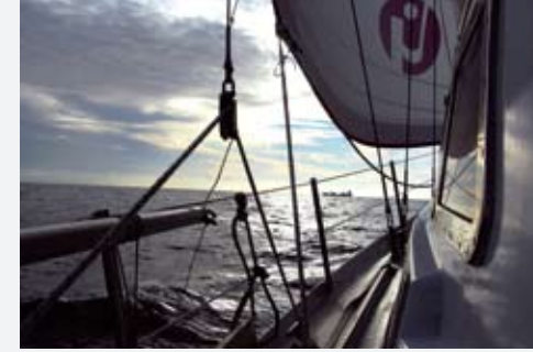
Uzaklar II sükunetle yol alıyor....