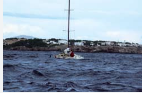
Fırtına sonrası ölü dalgalar...