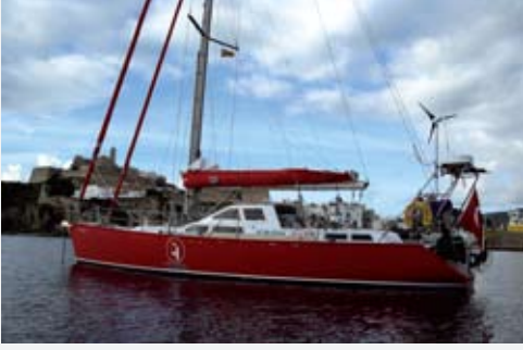
Uzaklar II, Ibiza Adası'nda.