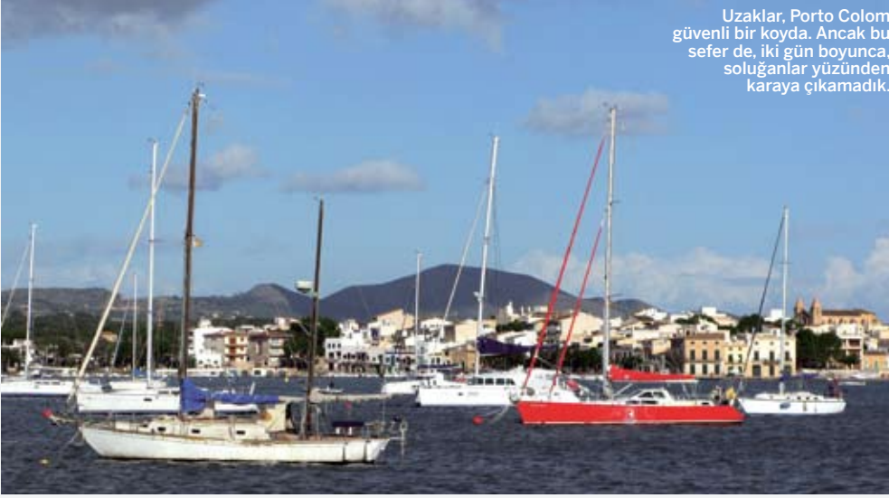
Uzaklar, Porto Colom güvenli bir koyda. Ancak bu sefer de, iki gün boyunca, solugañlar yüzünden karaya çıkamadık.