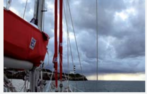
Porto Colom Feneri'ne doğru...

karayele döndüğünü fark ettim. Sibel çırpınan yelkenleri toplamaya çalışıyordu.