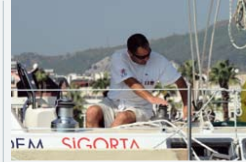
Teknede iş bitmez...