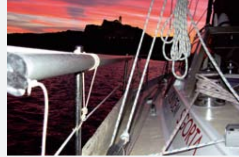
Uzaklar II'nin pruvasında Ibiza Adası görünüyor.