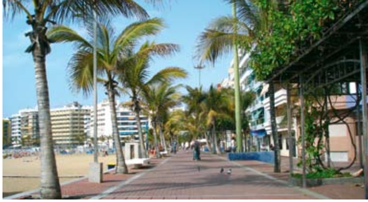
Las Palmas'ta kordon boyu