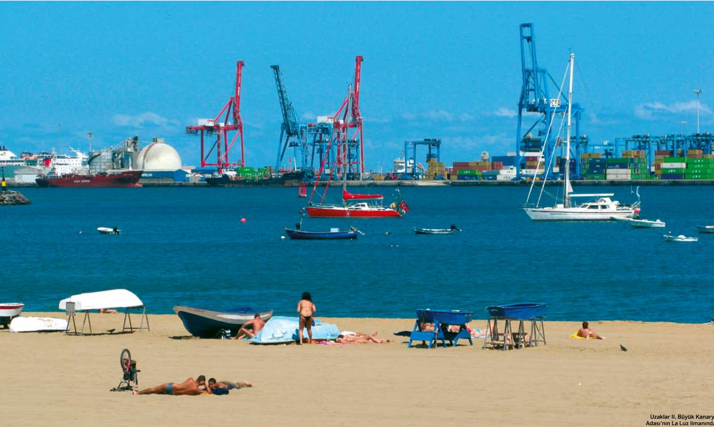
Uzaklar II, Büyük Kanarya Adası'nın La Luz limanında.

Uzaktan bakarak fikir sahibi olunmuyor. Bir yeri ve insanlarını tanımak için karaya çıkıp insanların arasına karışmak gerektiğini Graciosa Adası'nda bir kez daha anladım.