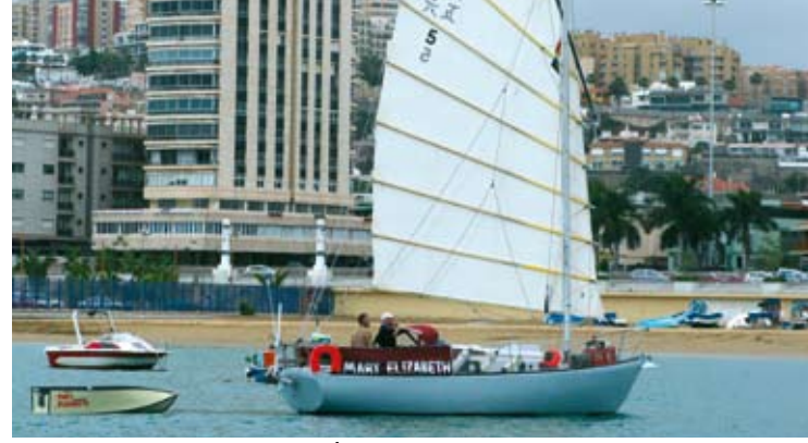
Uzak Doğu'ya özgü junk arma bir İngiliz yelkenlisi