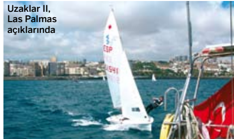
Uzaklar II, Las Palmas açıklarında