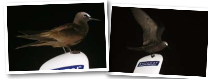
Rüzgâr dümenine konan kara kuş tekneyi rotasından çıkardı.

Akşam kamarada yemek yerken teknenin hareketlerinde bir gariplik hissediyoruz. İki gündür alıştığımız ritmin dışında bir salınım